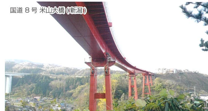
国道8号米山大橋（新潟）